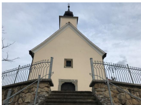
Slika 5: Cerkev sv. Lenarta

Cerkev sv. Lenarta leži na hribu nad središčem Makol in je nastala v pozni gotiki. Glavni oltar je delo Mihaela Pogačnika iz leta 1730. Vhodna vrata imajo vklesano letnico 1827. Cerkev je bila nazadnje predelana leta 1930.