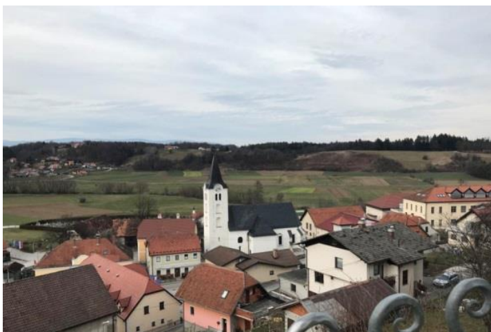
Slika 13: Pogled na Makole