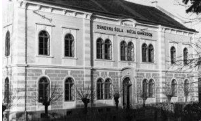
Slika 1: Šola nekoč

Osnovna šola Anice Černejeve Makole je šola vedoželjnih, strpnih, pravičnih in solidarnih. Imenuje se po pesnici Anici Černejevi, ki je pisala pesmi za otroke in odrasle. Osnovna šola je edina šola v občini in je lani praznovala 140. obletnico.