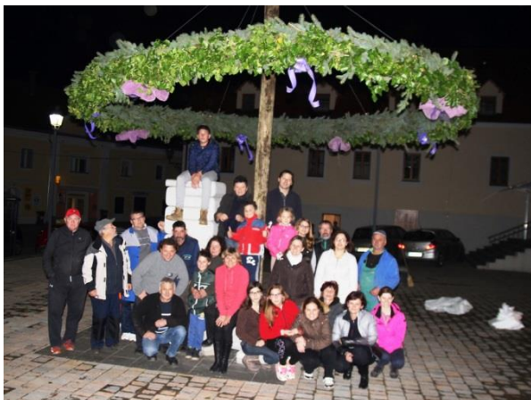
Slika 8: Dogajanje na makolskem trgu

Dogajanje na trgu v Makolah pomembno oblikuje življenja Makolčanov, zlasti na »andrejevo«, ko se zahvalijo svojemu farnemu zavetniku sv. Andreju, ki je tudi zavetnik ribičev, mesarjev, rudarjev, ljudje pa se mu priporočajo še za dobro poroko. Tukaj se odvija sedaj že tradicionalni Andrejev sejem, prepoznana prireditelj v občini in njeni širši okolici. Takrat se na trgu predstavijo različni lokalni ponudniki Dravinjske doline. Letos se je na stojnicah predstavilo nekaj manj kot 40 društev, rokodelcev in drugih razstavljalcev.