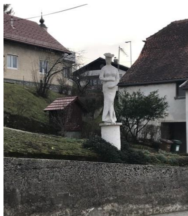
Slika 9: Nosečnica