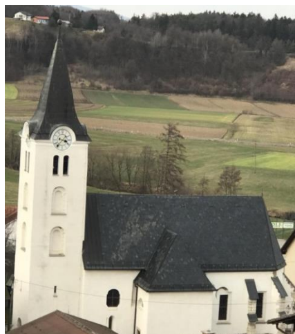
Slika 6: Cerkev sv. Andreja

V središču Makol je gotška cerkev sv. Andreja, ki se v arhivskih virih prvič omenja leta 1375. Od gotške cerkve je ohranjen prezbiterij. Cerkev sv. Andreja je tudi glavna župnijska cerkev. V letu 2017 je obeležila 250-letnico župnije v Makolah. Pomembno obletnico so zaključili s farnim žegnanjem – praznovanjem župnijskega in krajevnega zavetnika sv. Andreja, apostola. Slednje se je že leta nazaj dodobra ukoreninilo kot »Andrejeva nedelja« ali »andrejevo«. Tudi pred leti ustanovljena občina si je za občinski praznik izbrala župnijsko in krajevno praznovanje, torej godovni dan sv. Andreja – 30. november.