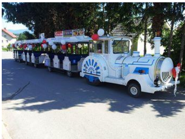
Slika 11: Turistični vlakec

Vlavec je sestavljen iz treh prilagojenih vagonov. Vleče ga lokomotiva, prilagojena za vožnjo po cesti. Je ozvočen, možno ga je najeti za organizirane skupine, ki obišejo Makole in ožjo ter širšo okolico.