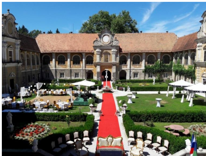
Slika 7: Dvorec Štatenberg

Dvorec je izjemno lep in veličasten ter primeren za vse, ki želijo spoznati slovensko kulturno dediščino ali pa tukaj praznovati. Odprt je v soboto in nedeljo.