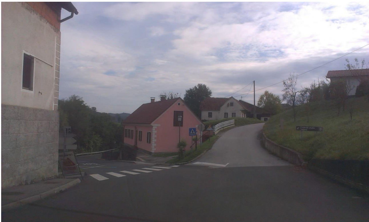
Fotografija 2: Prehod za pešce – objekt Mungo