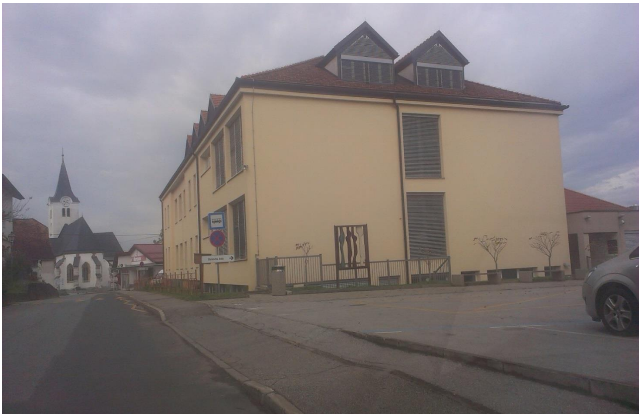
Fotografija 1: Dvorišče Osnovne šole Anice Černejeve Makole