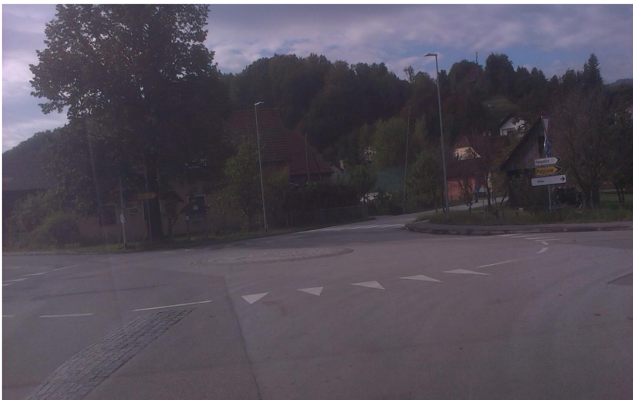
Fotografija 3: Krožišče Makole