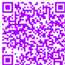
Slika 13: Vijolica