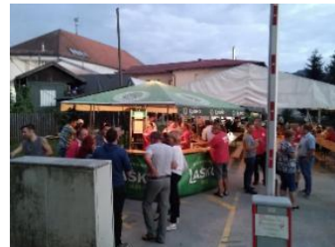
Slika 30: Gasilska veselica

Ta dogodek že več let organizira PGD Makole z namenom, da se občani družijo in se imajo lepo.