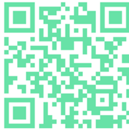
Slika 9: Lipa