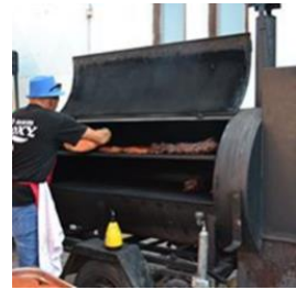
Slika 28: Smoke fest

Leta 2019 je Zavod Ma-kole organiziral prvi Smoke fest na Andrejevem trgu. Festival je bil tekmovalne narave. Udeležilo se ga je 10 skupin iz celotne Slovenije. Festival je trajal cel dan. Tekmovali so v dimljenju mesa (svinjska rebra, goveja rebra in BBQ-krožnik). Najboljša skupina je dobila nagrado.