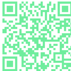
Slika 11: Žajbelj