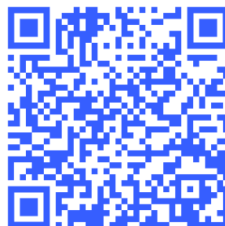
Slika 20: Pljučnik