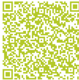
Slika 10: Janež