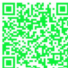
Slika 4: Meta