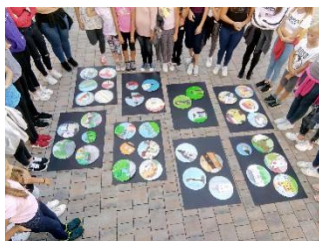
Slika 26: Forma viva OŠ Anice Černejeve Makole