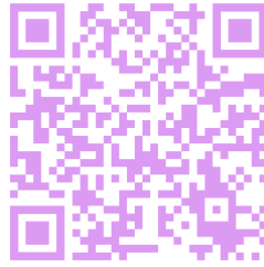
Slika 17: Smetlika