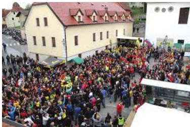
Slika 24: Andrejev sejem

Andrejev sejem organizira Turistično društvo Makole ob občinskem prazniku na prvo adventno nedeljo. Sejem se je lani zvrstil že 11. leto zapored. Na njem se predstavijo različni obrtniki iz bližnje in širše okolice ter prodajajo svoje izdelke in pridelke.