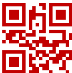
Slika 15: Šipek