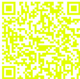
Slika 12: Zlata rozga