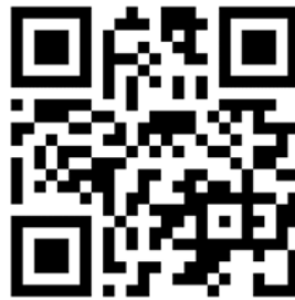
Slika 18: Robida