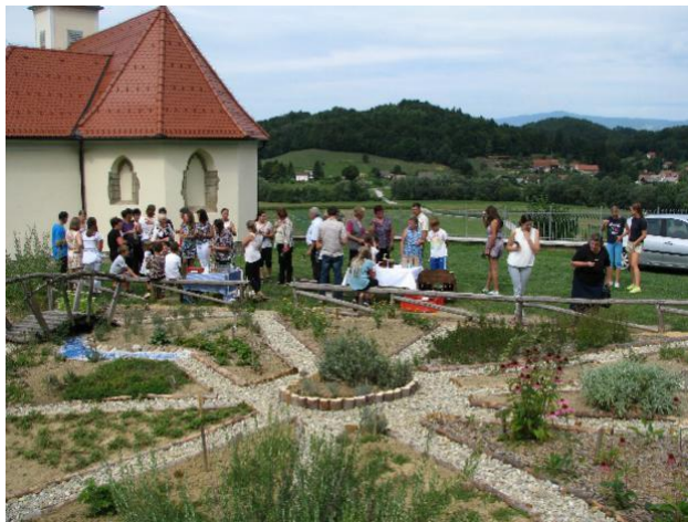
Slika 32: Žegnanje zelišč

Nekoč so imeli v Makolah vsako leto za zahvalo na veliki šmaren (15. avgusta) blagoslov zelišč. V Lavantinski škofiji je bil blagoslov zelišč prisoten le v Makolah (Vir: Praznično leto Slovenca, Niko Kurent.). Gospodinje so za blagoslov same izdelale šopke iz zdravilnih zelišč, ki so jih imele doma. Med in po drugi svetovni vojni je običaj počasi zamrl, članice Sekcije zeliščark Makole pa so ga v letu 2017 po mnogih letih znova obudile. Za blagoslov so pripravile šopke iz zdravilnih zelišč, ki so jih po končani maši razdelile med prisotne. V letu 2018 pa so bile deležne veselega presenečenja, saj se je med prisotnimi pojavila tudi gospa s svojim šopkom zelišč. V prihodnje si članice društva želijo, da to ne bi bilo izjema, ampak bi se vedno več domačinov odločilo za ponovno vzgojo zeliščnih rastlin, znanja o zeliščih pa bi želele prenesti tudi na mlajše generacije.