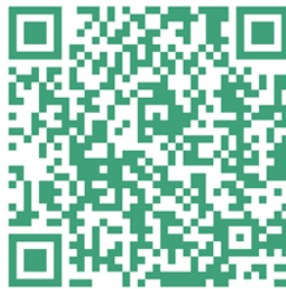
Slika 7: Rman