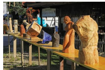
Slika 25: Forma viva Makole

Forma viva ima v Makolah že lepo tradicijo. Organizira ga Kulturno umetniško društvo Forma viva Makole na začetku meseca septembra. Takrat umetniki z vsega sveta ustvarjajo po Makolah na prostem. V tem času poteka tudi otroška likovna kolonija za učence osnovne šole v organizaciji OŠ Anice Černejeve Makole.