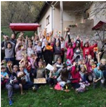
Slika 31: Dan jabolk

Kot zelo uspešno se je izkazalo sodelovanje sekcije zeliščark Makole z Zavodom Ma-kole, ki so lani že drugo leto zapored skupaj organizirali dan jabolk in bezgov dan za osnovnošolske otroke. Na obeh dnevih so otroci pod mentorstvom izdelovali različne stvari iz jabolk in bezga.