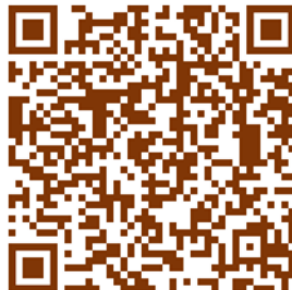
Slika 19: Preslica