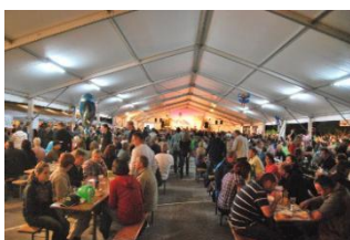
Slika 27: Idi na Makole

Ta dogodek je organiziralo Turistično društvo Makole. Osrednje dogajanje je potekalo na trgu v Makolah. Tam Turistično društvo Makole ponuja odprto kuhinjo, dobro kapljico in dobro glasbo.