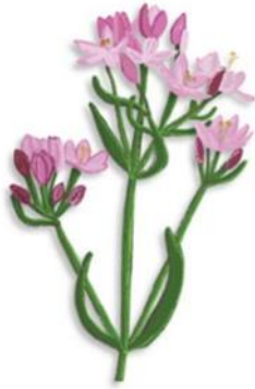
Slika 1: Tavžentroža

Čas cvetenja: junij, julij, avgust, september