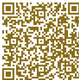
Slika 2: Kumina