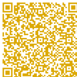
Slika 16: Šentjanževka