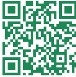
Slika 21: Melisa